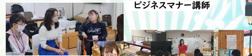
Auto creencia 代表 ビジネスマナー講師