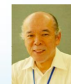
K-SKY OFFICE 代表

社会に出る前に必要な心得に ついてお話をいただきました。 支援学校から実習生も来ていた ので、大変学び深い時間になり ました。ありがとうございました。